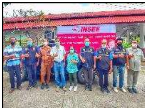
รูปที่ 2-13 (ต่อ) ตัวอย่างกิจกรรมชุมชนสัมพันธ์ระหว่างเดือนกรกฎาคม - ธันวาคม พ.ศ. 2565