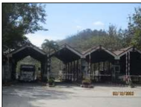
รูปที่ 2-12 ด้านซังน้ำหนักรถบรรทุกเข้า-ออกโครงการ