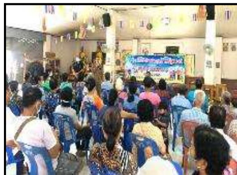
รูปที่ 2-13 ตัวอย่างกิจกรรมชุมชนสัมพันธ์ระหว่างเดือนกรกฎาคม – ธันวาคม พ.ศ. 2565