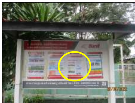
ประชาสัมพันธ์บริเวณ รพ.สต. หนองผักบุ้ง