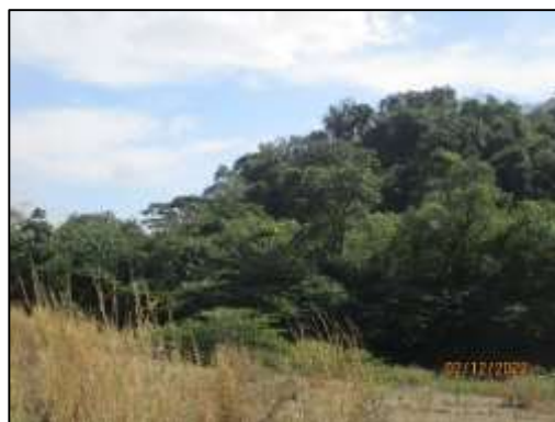
รูปที่ 2-2 พื้นที่ที่ไม่เกี่ยวข้องกับการทำเหมือง และ Buffer Zone