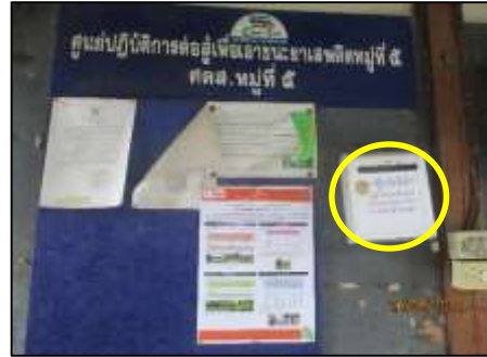
กล่องรับเรื่องร้องเรียน หมู่ 5