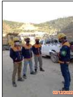
รูปที่ 2-16 พนักงานสวมใส่อุปกรณ์ป้องกันภัยส่วนบุคคล (PPE)