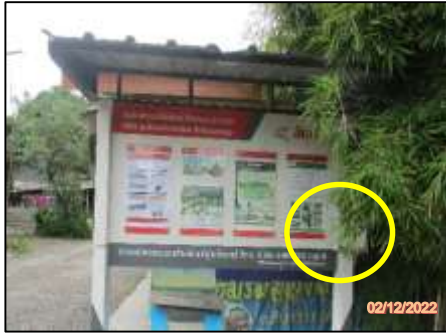
กล่องรับเรื่องร้องเรียน หมู่ 4